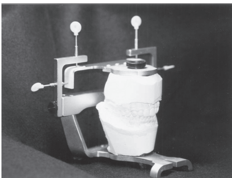
圖 2. 將已置位的上下顎模型轉移到 Vericheck 上

Vericheck 咬合器 (Denar Corp., Anaheim, Calif.) 可用於三度空間上分析中心關係髁頭位置的變化 (25,26) 。接著將已置位在咬合器上的上下顎模型轉移到 Vericheck 咬合器上 (圖 2)，Vericheck 咬合器兩側的垂直與水平懸臂貼上方格紙，以指針在方格紙上標示所有受試者的最大咬頭嵌合位，並藉由中心關係咬合記錄標示中心關係位。記錄完成後撕下方格紙貼在卡片上照相，照相時將卡片至於複拍架上以照相機 (Nikon F601, Macro 105mm, Japan) 鏡頭 1:1 倍拍攝，並沖洗放大成 4" × 6" 之照片方便計算距離。