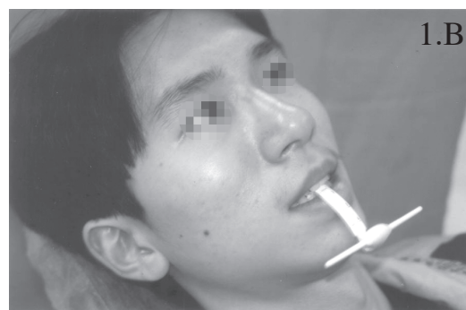
圖 1. A 引導滑板 (sliding guiding inclined gauge)；1.B 使用引導滑板誘導中心關係位，受試者斜躺 45 度，在放鬆狀態下誘導中心關係位。